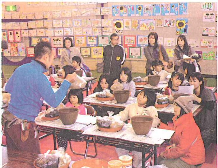
土のブレンド方法を習う「植」体験