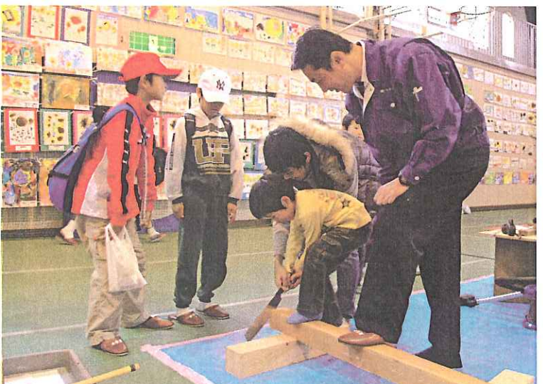
「職」体験でノコギリ引きに挑戦